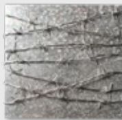
PAIN® BARBED WIRE