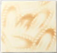
PAIN® HOT IRON