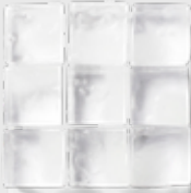
PAIN® ICY COLD