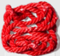
PAIN® SHARP SPASM