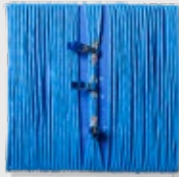
PAIN® NERVE PINCH