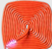
PAIN® ELECTRIC SHOCK