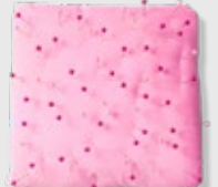
PAIN® PINS & NEEDLES